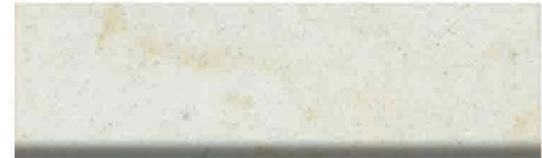
Culoare nr. 10, 310