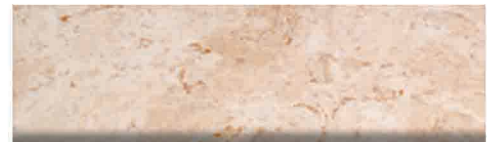
Culoare nr. 17, 317