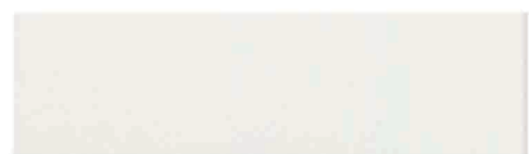
Culoare nr. 95M

Se taie pe lungime la dimensiunile solicitate. Termenul de livrare este de maxim 7 zile. Aticele comandate nu pot fi returnate. Sunt posibile usoare variatii de culoare.