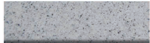
Culoare nr. 30M, 330M