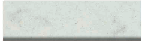
Culoare nr. 18, 318, 318M