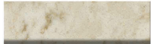
Culoare nr. 91, 391, 391M