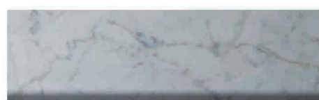
Culoare nr. 68 Roma

Glafurile se taie la dimensiunile solicitate. Termenul de livrare este de maxim 7 zile. Glafurile comandate nu pot fi returnate. Sunt posibile usoare variații de culoare.