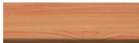
Culoare nr. 55 Cireș