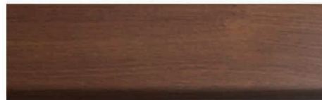
Culoare nr. 51 Nuc