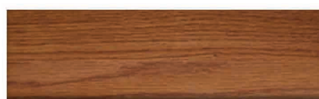
Culoare nr. 57 Stejar Auriu