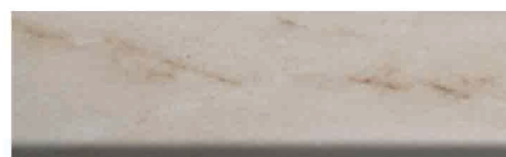
Culoare nr. 61 Marmor