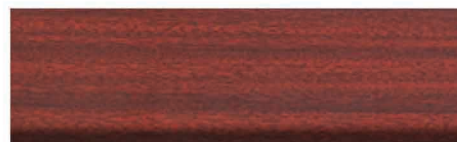
Culoare nr. 53 Mahon