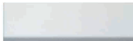
Culoare nr. 66 Alb