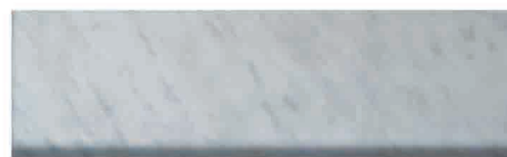
Culoare nr. 62 Carrara