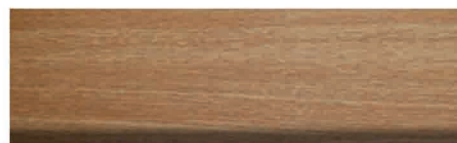
Culoare nr. 50 Stejar